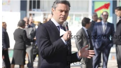
Declaraciones a la prensa del secretario Aurelio Nuño Mayer

( /sep/videos/entrega-del-premio-nacional-de-ciencias-y-artes-2015-17837 )