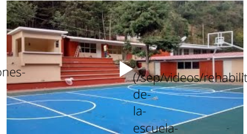
Rehabilitación de la Escuela Primaria "Lic. Gustavo Díaz Ordaz", Oaxaca.