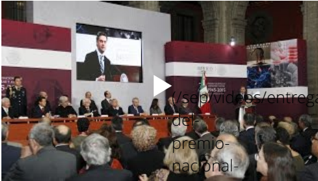
Entrega del Premio Nacional de Ciencias y Artes 2015

( http://www.gob.mx/sep/galerias/reunion-con-asociaciones-civiles-para-establecer-lazos-y-dar-seguimiento-a-la-aplicacion-del-programa-nacional-de-sistemas-de-bebederos )